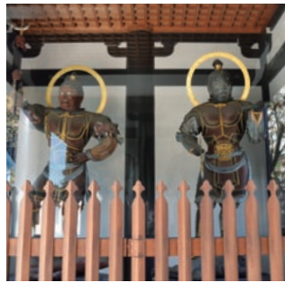
▲山門の四天王像(藪内佐斗司作)

知る人ぞ知る、 港区&周辺のおススメの 場所・建物をご紹介します。 近くを通ることがあれば、 ぜひのぞいてみましょう！