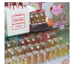
▼東京タワー型のハチミツ