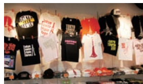
▶若い女性を意識した品ぞろえの売店。(3階タワーギャラリー3・3・3で)

空気の澄んでいるこの季節、展望台からの景色は、はっきりと遠くまで見渡すことができます。東京タワーのホームページをチェックのうえ、出かけてみてはいかがでしょうか。