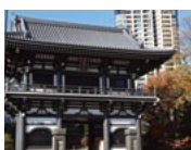
曹洞宗 萬年山 青松寺