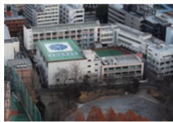
1889(明治22)年創立。2000(平成12)年から男女共学。2011(平成23)年に122周年を迎えた。生徒数約860名。港区芝公園3-1-36

「現在、学校のある芝公園3丁目町会の会計監査を頼まれて務めています。最初、この町会の新年会と納涼会が、慣例として東京プリンスホテルで開催されていることに驚きました。“なんで町内会の寄り合いがホテルで?”と思いました。この辺りには企業も多く、伝統のあるお寺も多いからでしょうか。ほんとうにびっくりしました。」